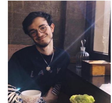
Sokol Toçilla Ma BCBT