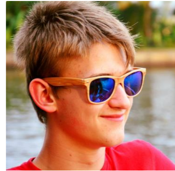
Norick De Vlamynck Ba Chemie