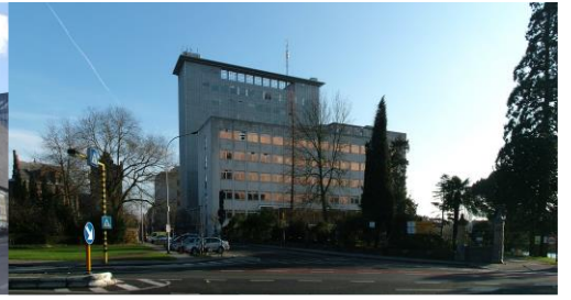
LED - Ledeganckstraat 35

Eens jouw curriculum is samengesteld, kan je jouw persoonlijke lessenrooster ook bekijken via Oasis, Mijn kalender . Meer info over lessenroosters is ook te vinden op onze website .