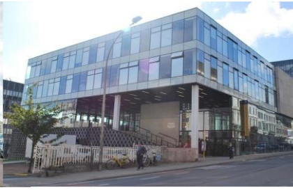
UFO - Sint-Pietersnieuwstraat 25