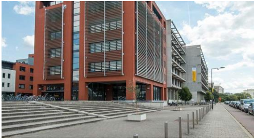
DUN - Henri Dunantlaan 2

De kolom Lokaal geeft aan waar de lessen doorgaan. Je hebt vooral les op de volgende locaties :